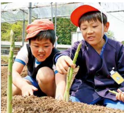
▲収穫を体験する児童

2027年に統合を控える府中市立上下南小学校の3年生2人が4月28日、アスパラガスの収穫を体験しました。上下町の農事組合法人井永が2012年から協力し、地域の産