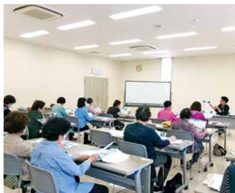
▲講習会を受講する女性部員

JA女性部庄原地区本部比婆西城支部は4月27日、庄原市の比婆西城支店で「夏・秋野菜づくり講習会」を開催し女性部員25人が参加して「野菜が好む土づくり」について理解を深めました。