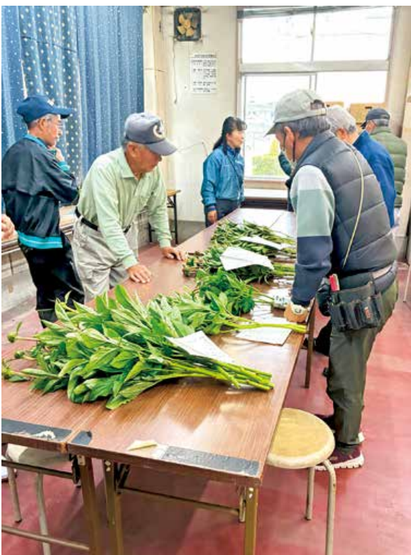
▲出荷作業を行う生産者

同部会は、シャクヤクで地域を明るくしていくと、2017年に結成され、今年で10年目となります。部員16人が33・6aで「レッドチャーム」や「春の粧」など、15品種3000株以上を栽培しており、出荷時には、品種によって背丈を60〜80cmに揃え出荷規格を徹底。下葉を処理して、つぼみのまま1箱30本で出荷します。