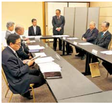
▲地域農業の振興に向けて意見交換

JAは2025年度の農畜産物の販売実績や第1次中期3カ年計画・第2次営農振興計画に