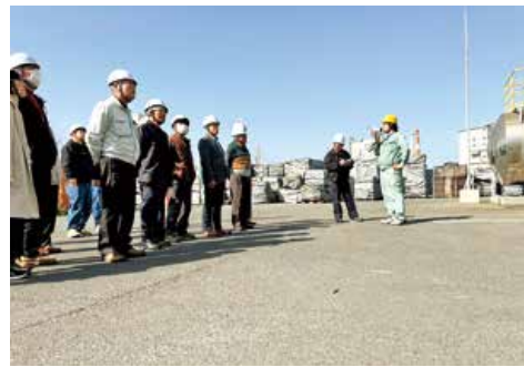
▲肥料製造工場を見学する参加者

視察研修は、夏場の生産量の増加や栽培環境の改善、産地の活性化などに向けて企画しました。エムシー・ファーターティコムの担当者が、植物体の活性を促す肥料や省力化につながる肥料などを説明。参加者は、製造工程を見学して、不安定な世界情勢による肥料原料の高騰や今後の