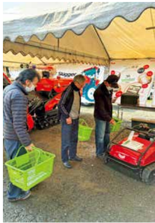
▲中古農業機械を確認する来場者

JAは3月7日、庄原市戸郷町の旧庄原家畜市場で中古農機展示会・墓石展示予約会を開きました。厳選した中古農機約70台と墓石8基を展