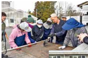
▲草刈機の操作説明

JA広島北部地域営農経済センターは水稻栽培技術の次世代への継承を目的に、米づくりの経験がない女性を対象にした『初めての米づくり講座2026』を開講しています。 3月19日に行われた第3回では「体験トラクター・草刈機の操作と事故のワケ」と題して18人が参加。農業用機械事故が毎年発生していることを挙げ、2組に分かれてトラクターと草刈機の手入れや操作の仕方などの説明を受けながら、どういったことに気を付けるべきかを学びました。受講者からは次々と質問が飛び「今まで何となく使っ