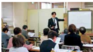
▲大朝支部(マネーセミナー)