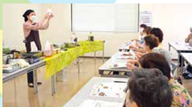
▲こめ油料理講習会