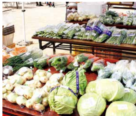
▲管内産の新鮮な野菜が並びました

このイベントは、住民の交流を図り、元気な海田町をつくるため、海田住民活動ネットワークと海田市祭り実行委員会が主催で開催しています。会場では、手作り市&グルメ市やふれあい選び市、体育館会場では、ステージ&体験市があり、会場は賑わいをみせました。このお祭りは、海田住民手作りの市ということもあり、いろいろなコーナーで手作りの品が販売されていました。海田市支店は、管内の新鮮野菜を販売する産直市を開