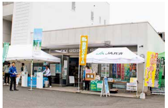
▲海田アグリセンター展示会