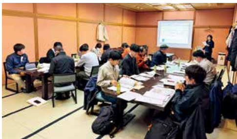
▲高温対策などを学ぶ生産者

JA全農は令和7年度から取り組む、広島アスパラ選果場の規格見直しの効果と販売の取り組みを報告しました。県農業技術指導所は、令和8年産の増収に向けた適正なかん水量とタイミング、褐斑病や茎枯病などの効果的な防除方法、高温対策などについて説明。参加者は防除暦や生産資材などについて意見交換しました。