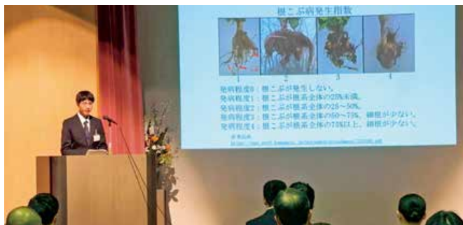
▲まとめた研究成果を発表する学生

県立農業技術大学校は2月4日、庄原市ふれあいセンターで卒業論文公開発表会を開きました。2年生29人の代表5人が、研究成果を10分の持ち時間で発表。栽培や経営に役立てようと、農業者や農業高校生、行政職員、JA職員ら約80人が参加しました。