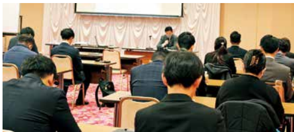
▲DVDなどを使って研修をしました

JA安芸地域は1月21日、27日の両日、海田市支店で「コンプライアンス研修会」を開催しました。より良い職場づくりに向けて「高いモラルやコンプライアンス」を持ったJA職員の育成を行なうことを目的に実施しました。研修では、不祥事件等の発生状況や不正のトライアングル、カスタマーハラスメント対策など学びました。また、コンプライアンス意識を高めるため、グループディスカッションを行ない、理解を深めました。JAはこれからもJAの総合事業を活かし、組合員や地域のみなさまの信頼に応えられるよう、コンプライアンス遵守の徹底と強化に取り組んでまいります。