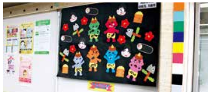
▲支店の展示の様子

JAは3月9日、JA共済の地域貢献活動として、安芸地域管内の幼稚園・保育園8園に、園児が図画や折り紙などを使って作成した作品を掲載したカレンダーを計1,450冊贈りました。次世代層の地域住民にJAを知ってもらい、親しみを持ってもらうと、各幼稚園・保育園から2カ月に1回作品を募集し、各支店で園児作品展として作品を展示しています。来店者は「鯉のぼりや節分など季節ごとのかわいらしい作品を楽しみに来店している」「作品があるのでも来店するのが楽しい」と好評です。カレンダーは、園ごとに作成し1年間の作品集として各園に贈りました。