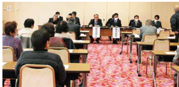
▲様々な意見や要望などをいただきました

JAは、2月20日、安芸地域の海田市支店と熊野支店の2会場で開催しました。地区別組合員集会を開催しました。「組合員との徹底した話し合い実践運動」を通じて、組合員のみなさまの意思を事業運営に反映することを目的に実施しました。JAの事業概況や営農振興計画、支店情勢、取り組み状況について説明し、JA運営や経営に関する要望について、さまざまな質問や意見をいただきました。JAは、みなさまのご意見を今後の事業運営に反映できるよう取り組みを進めてまいります。地域に密着した「なくてはならないJA」となるように、JA役員が「一丸となり、みなさまとともに進んでまいりますので、今後ともご理解とご協力をお願いいたします。」