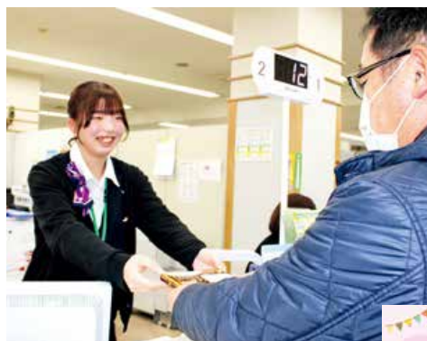
▲感謝の気持ちを込めてお菓子を手渡しました

地域のみなさまへ日頃の感謝の気持ちを込めて、バレンタインデーに合わせて企画しました。各支店でチョコレートやお菓子をそれぞれラッピングして用意し、来店者に手渡しました。来店者からは「思わぬプレゼントでうれしい」と好評でした。JAは、地域のみなさまとのふれあいを大切に、今後も親しみを持ってもらえる支店作りに取り組んでまいります。