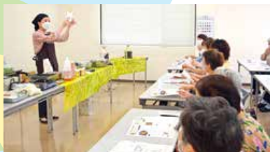
▲こめ油料理講習会