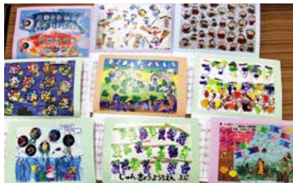
▲1年間の作品集となるカレンダー