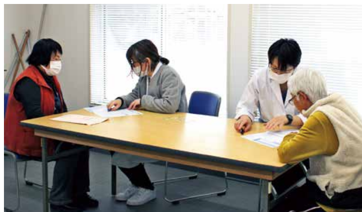
▲保健師の方が受診者個々の健診結果を説明しました

JA女性部は2月13日、熊野東ふれあい館で生活習慣病予防健診を行いました。JA広島総合病院と連携し、健康管理活動の一環として毎年実施しています。3月13日は、保健師の方をお迎えして健診後の報告会を行いました。報告会では、健診受診者のみなさんが保健師の方より健康状態の説明を受け、健康保持・増進のための改善を学びました。受診者は「定期的に受ける健康診断は大切だと思う。生活習慣を改善できるような日頃からの健康管理に取り組んでいきたい」と話されました。