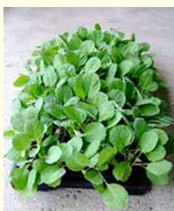
(商品例) キャベツ苗

JA安芸津アグリセンターでは、直売所などJA出荷者の支援として、128穴セルトレイでの野菜苗の生産・供給を行なっています。