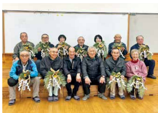
▲参加されたみなさん

参加者は「ワラの編み込みがとても難しかった。手づくりのしめ縄で無病息災を願うことができてよかった」と話しました。