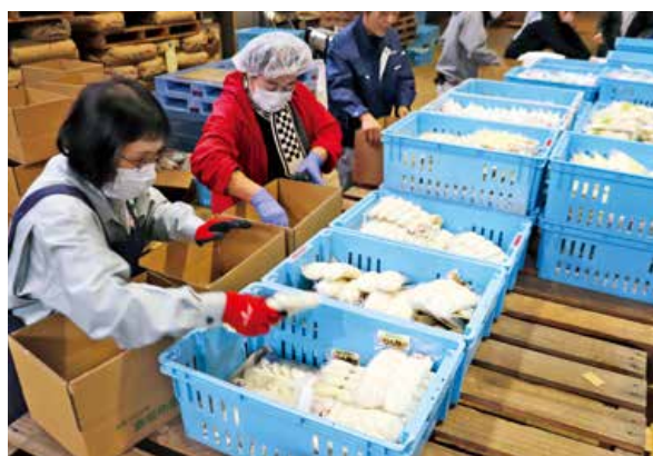
▲箱詰め作業するメンバーら

「ふるさと三次満喫物語」は、三次地域内外の人へふるさとの味を堪能してもらおうと15年前にスタート。現在は恒例の冬のギフトセットとして、多くの方に親しまれています。