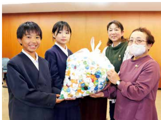
▲ペットボトルキャップを女性部に贈呈する児童

贈呈されたペットボトルキャップは、J A女性部が集めたペットボトルキャップと一緒に回収業者へ送られます。