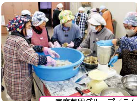
家庭菜園グループ／こんにゃく作り・ギョウザ作り