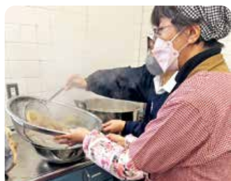
酒屋支部／こんにゃく作り