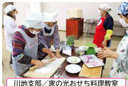
川地支部／家の光おせち料理教室