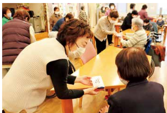
▲利用者にプレゼントを手渡すたんぽぽの会メンバー

プレゼントは、「やすらぎ館」利用者をはじめ、ヘルパー等を通じてJ Aの居宅介護利用者へも配られました。