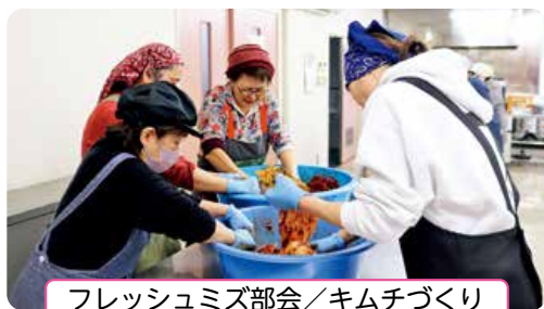
フレッシュミズ部会／キムチづくり