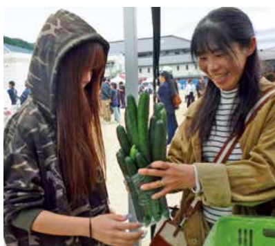
▲詰め放題に奮闘する来場者

会場は笑顔と歓喜に包まれました。東城支店ふれあい委員会は、無料カフェを開き、コーヒーなどを振る舞いました。