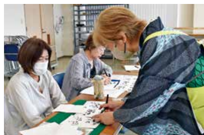
▲文字の太細を筆ペン1本で表現していきます

ていきました。参加者は「普段と全然違う書き方で新鮮だった。年賀状なども書くことが少なくなってきたけど短い文章でも想いが伝わると習ったので実践してみたい」と話しました。