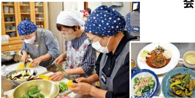
▲みんなの協力でどんどん料理が完成していきました

JA女性部美土里支部は9月24日に健康寿命を延ばすための取り組みとして厚生産業(株)の発酵食品を使った腸活料理教室を開き、16人が参加しました。 「だしを使った野菜炒め」や「塩こうじハンバーグ」など旬の野菜を使った料理にチャレンジ。手分けをして調理に取り掛かり、美味しい料理が出来上がりました。参加者からは「発酵食品を使って早く料理ができた。塩麹も入れるだけで簡単に味が決まり、大変美味しかった」と好評でした。