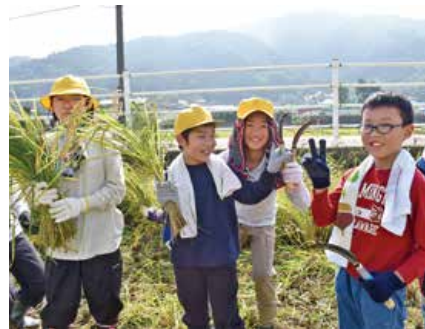
▲自分で刈った稲を持ってハイチーズ!