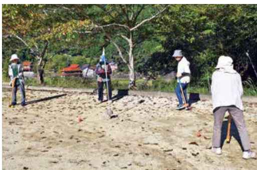
▲グラウンド・ゴルフを楽しむ部員たち

JA女性部向原支部は部員の親睦を目的としたグラウンド・ゴルフ大会を毎年開催しています。10月6日には秋晴れの中で27人が集まり、グループに分かれて8ホール2ラウンドをまわりました。ラウンド中にはホールインワンなど好プレーによる歓声や笑い声があがり、みんなですпорツの秋を楽しみました。参加者は「普段会わない人とも久々に話ができた。体を動かすこともできてとても楽しかった」と話しました。グラウンド・ゴルフは未経験者でも参加しやすいということで、各地域の女性部の活動にも取り入れられています。