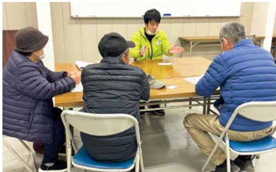
▲説明を行なう砂原営農指導員

JA広島北部地域営農経済センターは1月下旬から、新規に市場や産直市へ野菜の出荷を検討する方を対象とした個別相談会を管内8会場で開催しました。 会場では営農指導員が常駐し、品目に応じた野菜の栽培の仕方や出荷方法について提案やアドバイスをしない、参加者は熱心に耳を傾けていました。 相談は随時受け付けておりますので、出荷を検討されている方は各支店に駐在しております営農指導員、または営農経済センター（TEL 0826-54-0814）へお問い合わせください。