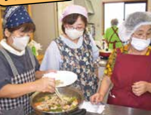
▲野菜たっぷり簡単料理講習会