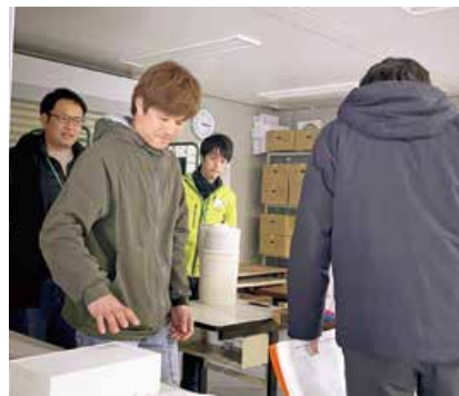
▲作業場の衛生管理も確認しました。