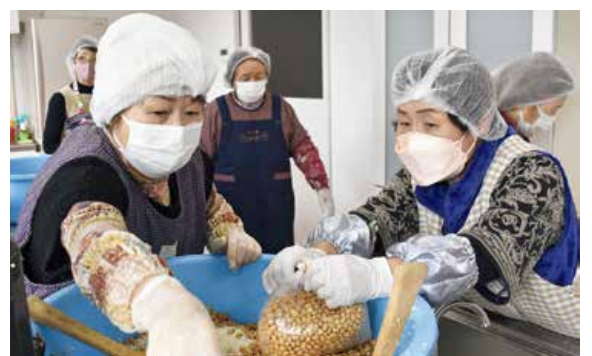
▲メンバーで協力して作業を行ないました。

JA女性部は今年も各地で手作りの味噌づくり講習会を開催しました。参加者からは味噌が美味しいと大好評で、毎年の人気行事の一つとなっています。1月29日には吉田支部のメンバー22人が各家庭で柔らかく煮た大豆を持参し、塩切り米麹と合わせて機械ですり潰したものを保存用の容器に次々と入れていきました。出来上がった味噌は1年ほど寝かせて完成します。今年も美味しくなりますように!