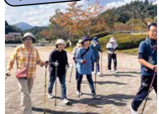
▲ノルディックウォーキング