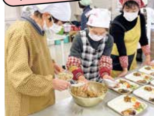
▲「家の光」おせち料理講習会