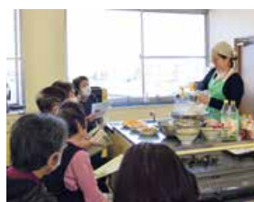
▲簡単に作れる体に良いレシピを学びました

JA健康大学坂支部は1月21日、安芸郡坂町の坂町立保健センターでお酢の料理講習会を開き、12人が参加しました。大興産業(株)の栄養士の方が、酢の食欲増進作用や殺菌効果、減塩や疲労回復につながることを紹介し、国産材料でこだわって製造している酢を使って手軽にできる「ツナとそばろのカレー風味ずし」「鶏むね肉の梅照り焼き」「きのこのおろし漬け」の3品を演習しました。料理を試食した会員は「さっぱり美味しく簡単に作れる料理だった。我が家のメニューに加えたい」と笑顔で話されました。