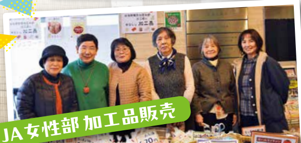
JA女性部加工品販売