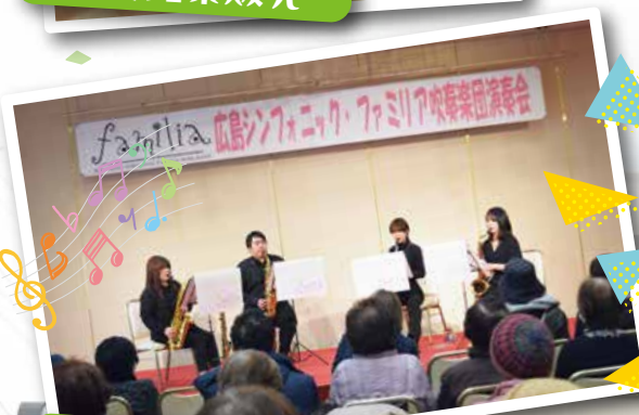
広島シンフォニック・ファミリア吹奏楽団演奏会 (吹奏楽団によるサクソ4重奏)