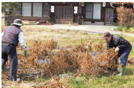
▲乾燥やサヤから豆を出す作業など出荷するまで手間がかかる黒大豆

JA青壮年連盟安芸地区本部は1月14日、熊野町の同連盟本部の圃場で熊野町特産の「丹波黒大豆」の収穫をしました。同町では寒暖差のある気候を利用して糖度の高い「丹波黒種」の黒大豆を全域で栽培しています。食農教育の推進として、昨年の10月には黒大豆のエダマメを収穫する「子ども野菜収穫体験」を実施しました。黒大豆エダマメは、通常の枝豆と比べて厚みが14mmと大粒で食べ応えがあり、甘みとこくが特徴です。