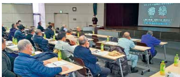
▲水稻の栽培技術などを学びました

JA全農ひろしまが、令和6年産の米穀情勢を報告し、水稻の肥料農業の新規品目やコスト低減に向けた大型規格を提案しました。県北部農業技術指導所は、水稻の高温障害による品質低下を軽減する管理技術を紹介。中国四国農政局広島拠点、令和7年産に向けた水田農業の取組方針を説明しました。