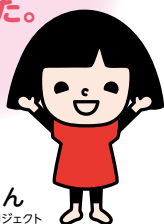
笑味ちゃん