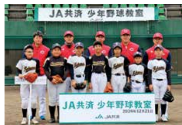
▲口和高野ベースボールクラブ

一緒にウォーミングアップを行ない、憧れの選手からアドバイスを受けながらキャッチボールや打撃練習に汗を流しました。選手たちは「周りへの感謝の気持ちを持って、家族や仲間を大切にして野球に励んでほしい」と子どもたちを激励しました。