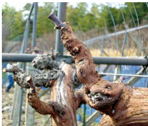
▲ブドウの粗皮剥ぎ後

発芽前に、越冬病害虫の防除を目的に「石灰硫黄合剤」(写真)を散布します。「石灰硫黄合剤」を使用する際の注意事項は以下の通りです。注意事項を確認し、樹種別の生育ステージ(表)にあわせて散布を進めていきます。