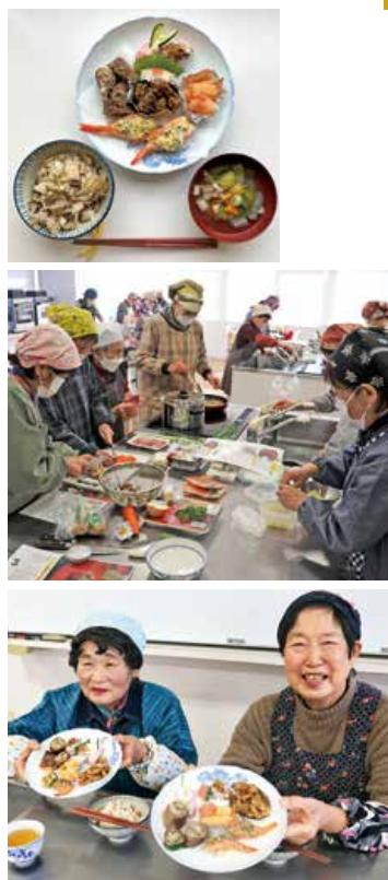
▲「家の光」を活用して作ったおせち料理

JA女性部三原地区本部は12月10、12日、雑誌「家の光」の記事を活用しておせち料理を作りました。家庭でのおせち料理の参考にできるように毎年取り組んでおり、今年