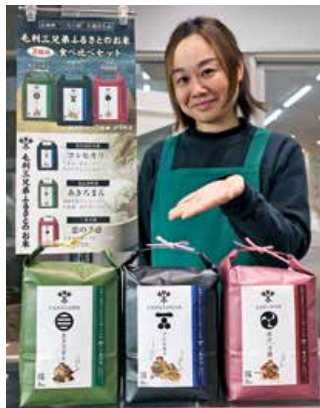
▲ふるさと納税共通返礼品 「毛利三兄弟ふるさとのお米 食べ比べセット」