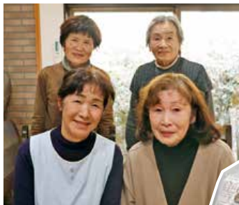
▲中之町支部女性部

三原市中之町の女性部員4人は女性部活動の一環としてサトイモを栽培し、「おばさんのうまいも」という商品名でやっさふれあい市場に出荷しています。栽培を通して地域を盛り上げたいという思いで2018年から始め、今では部員間の交流のきっかけにもなっています。