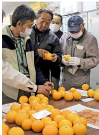
▲中晩かんの品質を確認する関係者

尾道市のJAせとだ選果場で12月19日、中晩かんの規格や品質基準を確認する会議を開きました。選果場長やJA広島果実連技師など関係者14人が、1月上旬の初出荷を前に生産状況を共有。ネーブル、はるみ、ハッサクの3種類を等級別に並べ、大きさや傷、病害虫などによる見た目の品質を確認し、基準を統一しました。