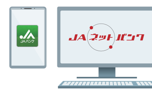
JAネットバンクサービス