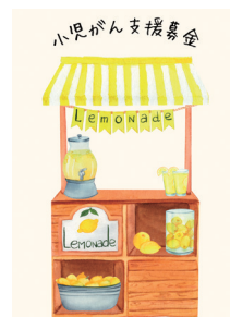
レモネードスタンド (小児がん啓発チャリティ)