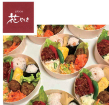
place 花やしき 弁当・ハーブソルト販売