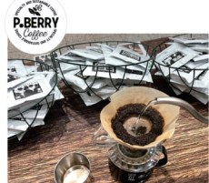
P-BERRY [カフェインレスコーヒー]