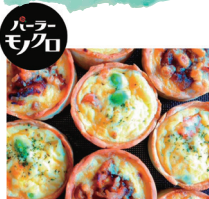
パーラーモノクロ [キッシュ]