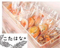
こたばな [ベーグル]