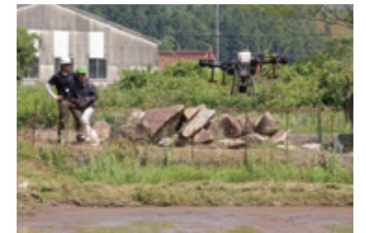
▲ドローンによる水稲直播試験

省力化や効率化を目指す中、水位センサーやスマホアプリでの水管理、水位センサーのアレンジによる給水の半自動化などスマート農業に積極的に取り組んでいます。