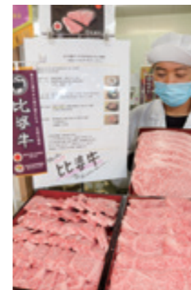
▲世界が注目する「比婆牛」 のフェア

J A庄原地域本部は5月27日から、庄原市の食彩館しょうばらゆめさくらミート工房でブランド和牛「比婆牛」の特別フェアを行ないました。「比婆牛」のステーキやすき焼き用など約400kgを用意。G7広島サミットの首脳の夕食会などで使われ、注目を浴びる「比婆牛」の魅力を、店頭やチラシで伝えました。