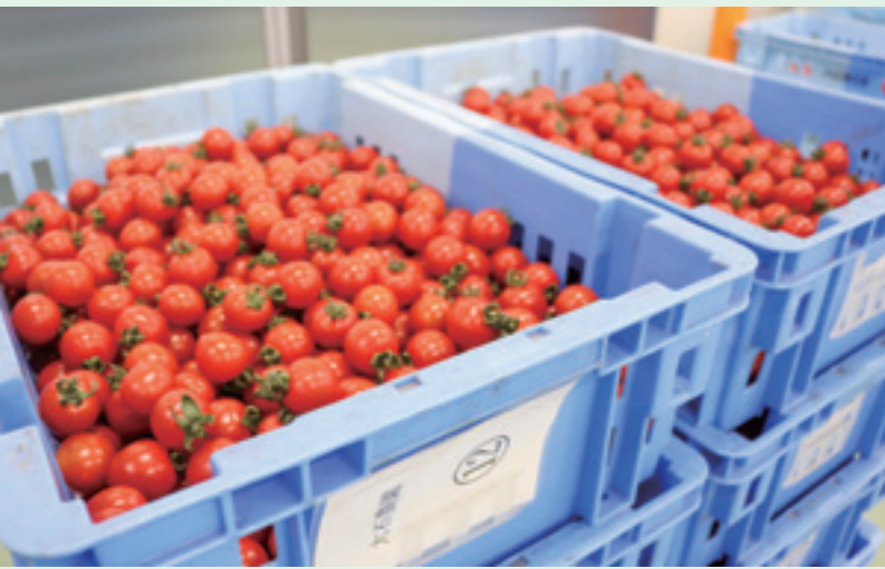
北広島町選果場に出荷されたミニトマト

・努力は決して裏切らない。 良い時も悪い時もあるけど、積み重ねた 経験はいつか生きる。必ず実を結ぶ。