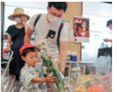
イベントでプレゼントのバラを選ぶ親子

毎週末はお米を特別価格で提供し、お客さまに定期的にご来店いただけるよう工夫しています。父の日には、店内商品をご購入いただいたお客さまに黄色いバラをプレゼントするなど、様々なイベントを通じて産直市を知ってもらい、根強いファンづくりに繋がっています。