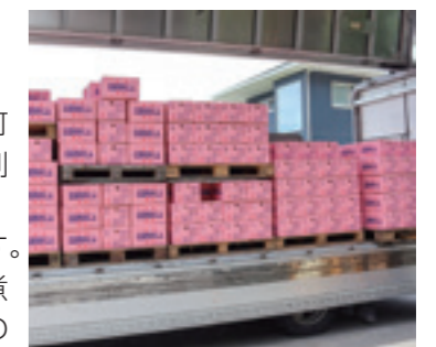
▲市場に出荷される「赤馬鈴薯」

「赤馬鈴薯」は、沿岸部に位置する同地域特有のミネラル豊富な赤土で育ちます。主な品種は、玉が丸く身が黄色い「デジマ」。ほくほくもちりと食感が良く、煮崩れにくいのが特徴です。赤馬鈴薯出荷組合は、春作で7月下旬までに450tの出荷を見込みます。