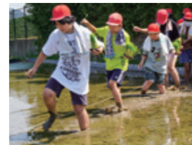
▲5月22日 宮原小学校5年生22人