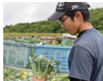
▲花蕾の締まったブロッコリー

5月31日、安芸高田市甲田町の有限会社援農甲立ファームでは、早朝から4人が収穫し6人が選果や箱詰めを急ピッチで進めました。今年、春作ブロッコリーは80aに24,000本を植え付け、品種は「SK9-099」を栽培。4月下旬から5月上旬に警報級の雨が降るなど排水に苦労し、それ以降の気温の上昇により例年より収穫時期が早まりましたが消毒が適期にできたため、締まりの良いブロッコリーに仕上がりました。