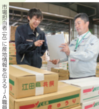
市場担当者(左)に産地情報を伝えるJA職員

JAひろしまは5月8日、中国四国地方の拠点市場である広島市中央卸売市場内に事務所を開設しました。専任担当者1人が、市場や青果・花き卸売などの関係者と連携を強化。県内産需要を掘り起こしながら、市場情勢を産地につなぎ、多彩な園芸品目の有利販売による農業者の所得増大を目指します。