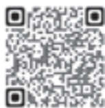
広島法務局ホームページ

詳しくは広島法務局不動産登記部門(TEL:082-228-5741)までお問い合わせいただくか、広島法務局ホームページをご覧ください。