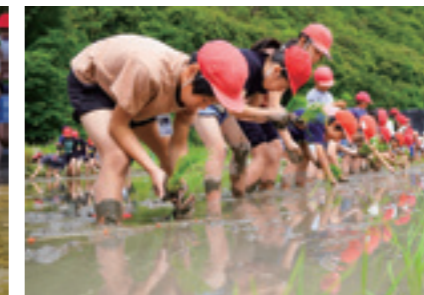
▲5月26日 三坂地小学校5年生62人

呉市立宮原小学校と三坂地小学校は、同市で田植えを体験しました。はだして田んぼに入りぬかるみに足を取られながら苗をしっかりと植え付けました。児童たちは「難しかった」「楽しい」「またやりたい」「大きくなるのが楽しみ」と笑顔で体験を振り返りました。